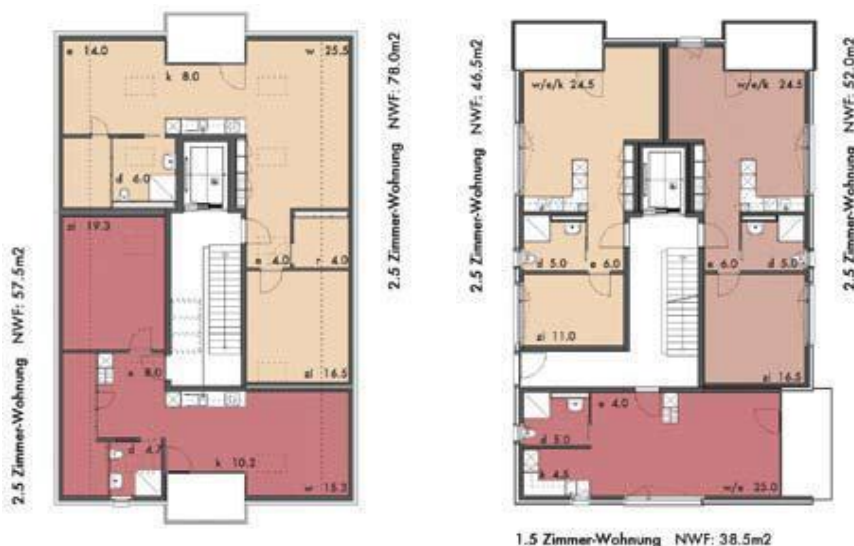
Grundrisse von Wohnetagen, repräsentativ für alle Häuser. Nicht abgebildet sind die Etagen mit den 3½-Zimmer-Wohnungen